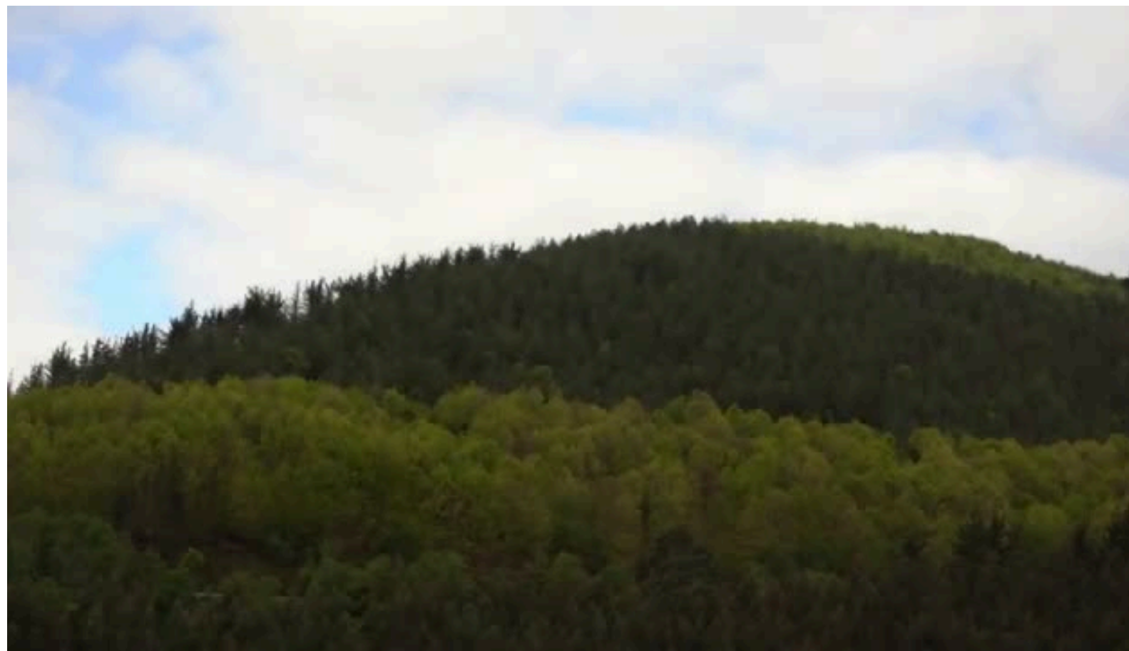
EHNE Bizkaia, KCD