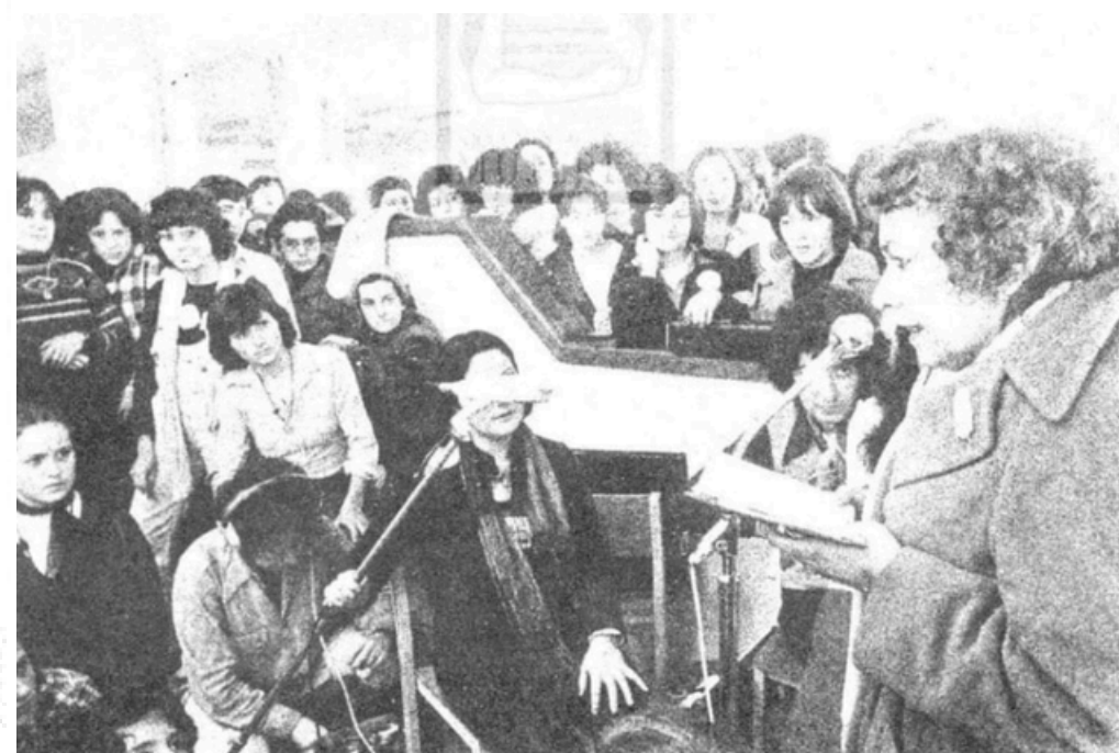
ENTIDAD: Movimiento Feminista de Euskadi LUGAR: Leioa AÑO: 1977